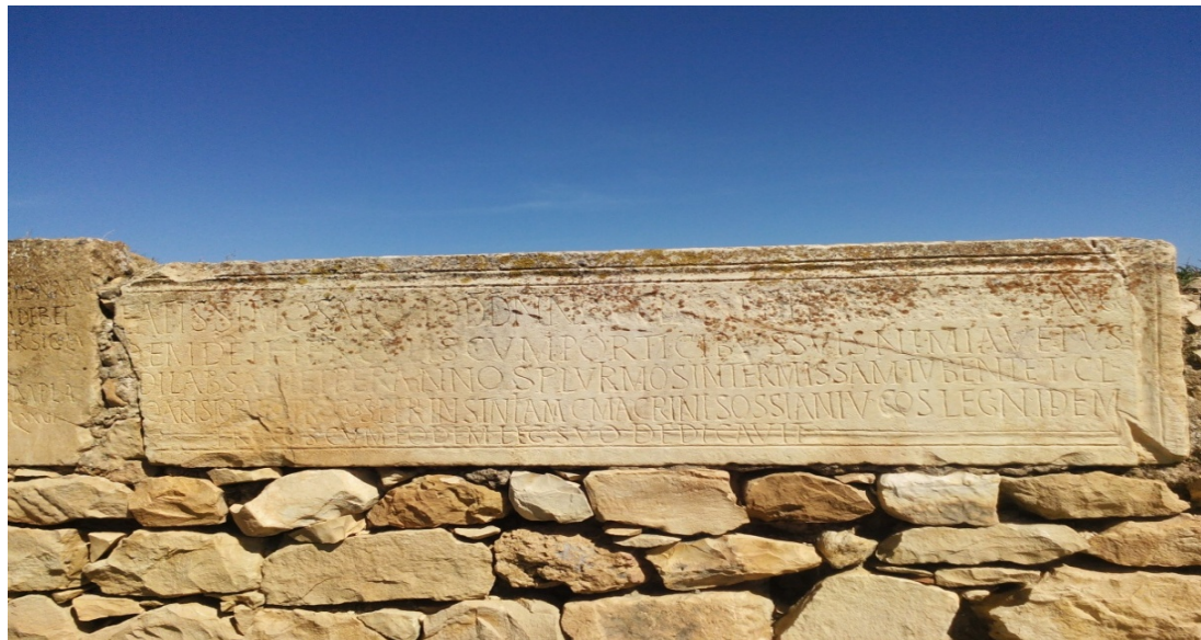
نقيشة رقم: 2048