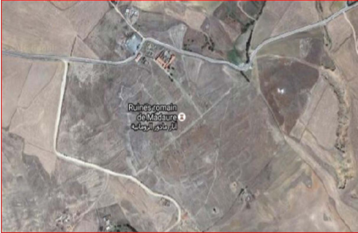
صورة رقم 01 : صورة جوية للموقع الأثري مادور

يمتاز مناخ المدينة بكونه غير قار وبارد، تصل فيه درجة الحرارة إلى ما دون الصفر، كما نجد الجليد في فصل الشتاء، نتيجة لعامل البرودة الشديدة، ومستوى التساقط جيد بحيث يفوق 500 مم سنويا.