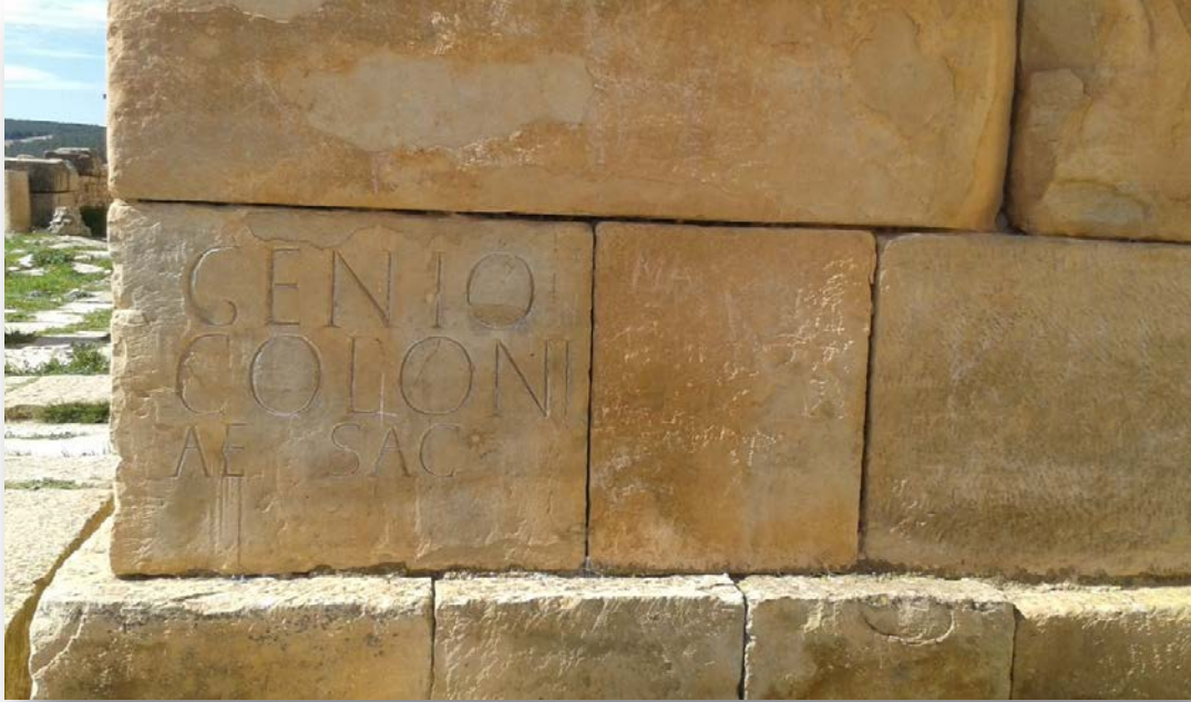
نقيشة رقم: 2043