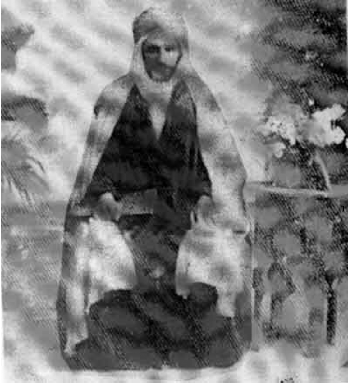
الشيخ عمر بن قدور