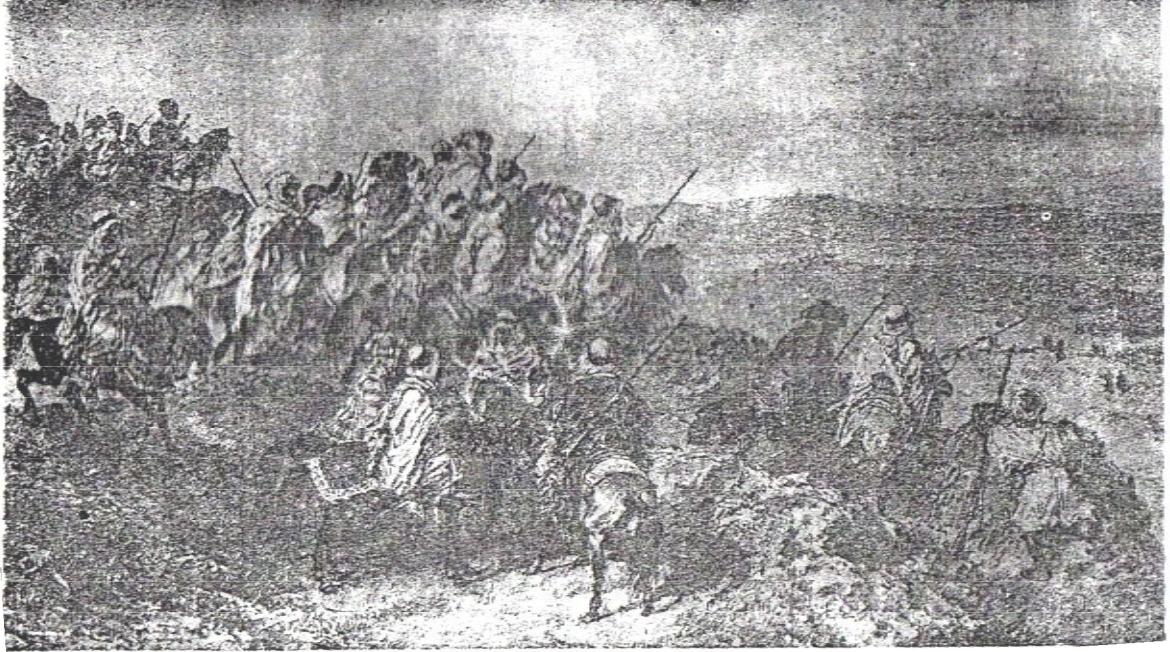
العمال في القدس