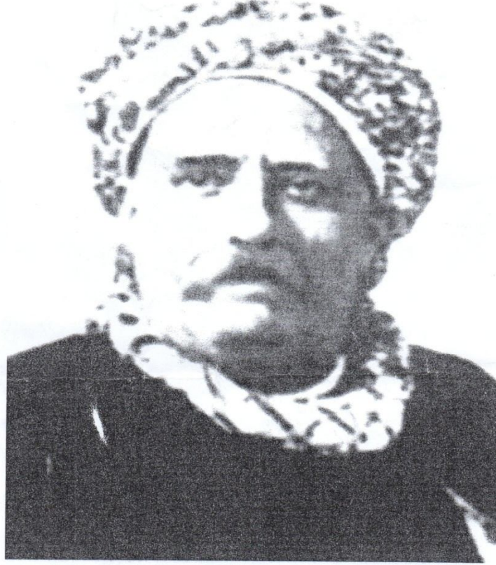
الشيخ محمد بن أبي شنب