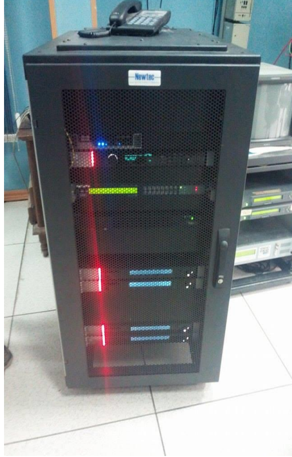
أونكودور جهاز البعث عن طريق الأقمار الصناعية