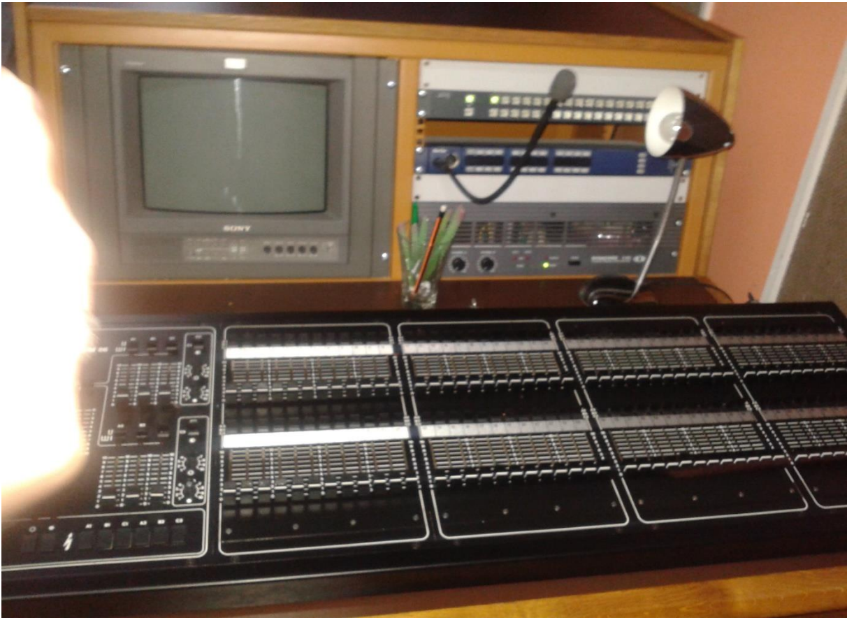
جهاز ضبط كاميرات التصوير بالأس튜디오