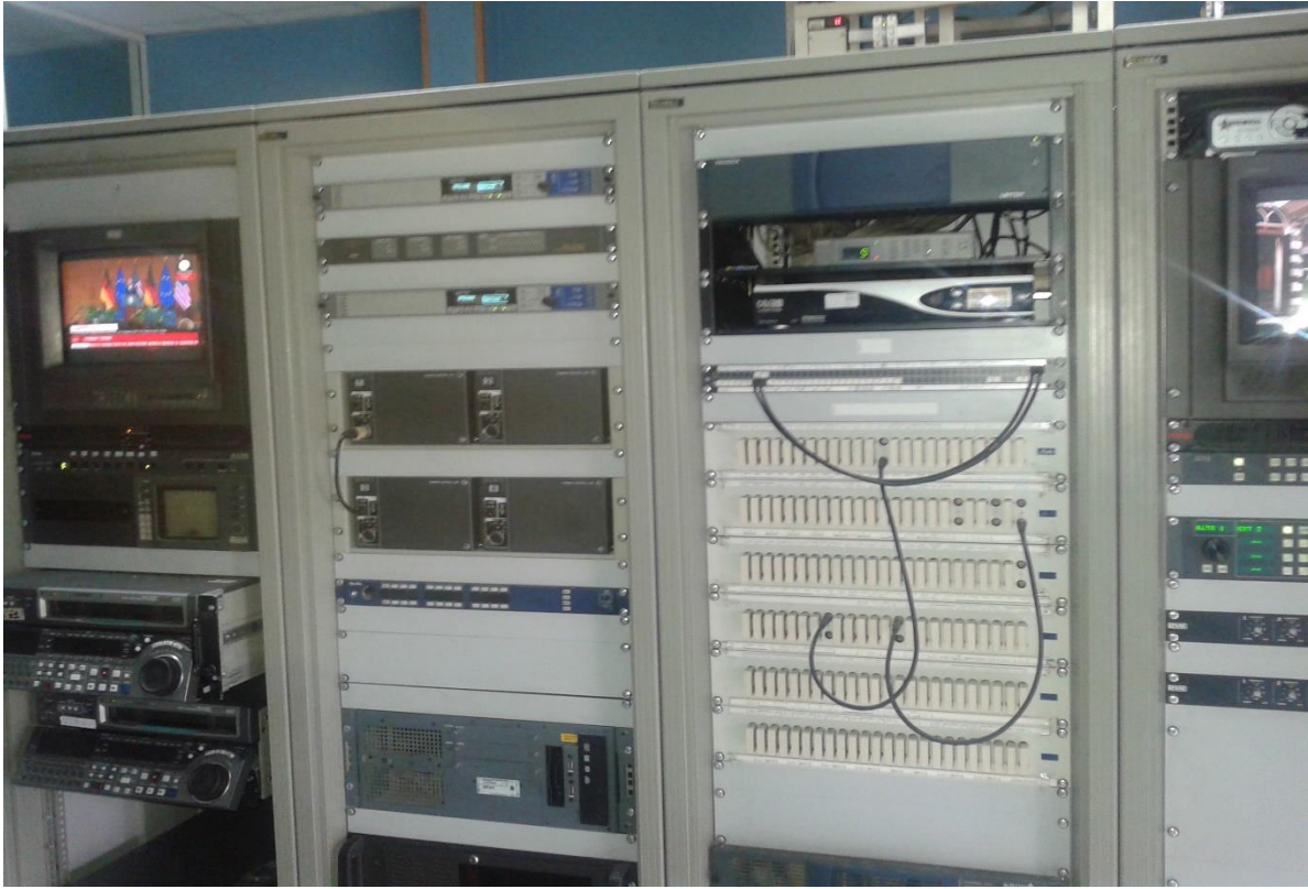
جهاز ضبط الصورة والصوت بالرفة التقنية