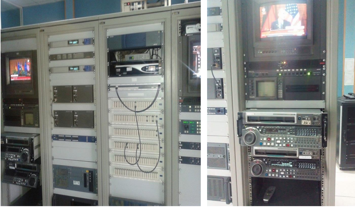
أجهزة ضبط الصورة والصوت

ويتكون القسم التقني على أجهزة خاصة بالصوت والصورة وهي عبارة عن مجموعة من الشاشات التي يتم من خلالها ضبط الألوان ودرجة التحكم في دقة الصورة والصوت.