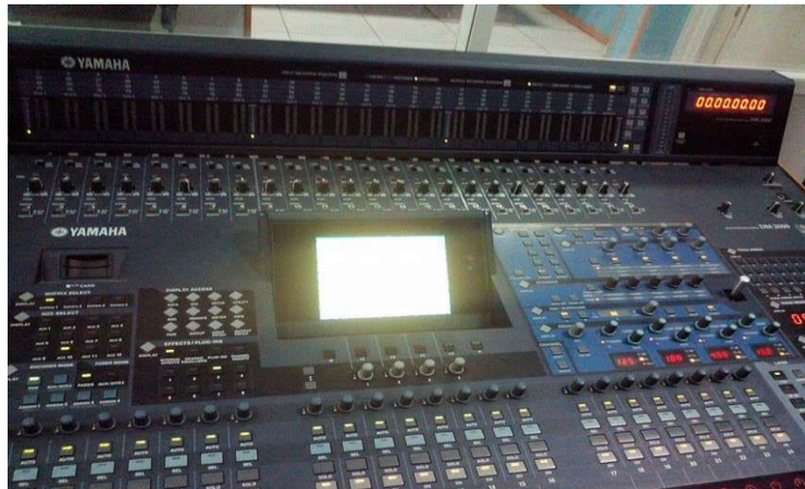
جهاز التقاط الصوت

أما بالنسبة للصوت فيتم التقاط الصوت في أحد الغرف التقنية المزودة بجهاز التقاط الصوت Ppiter son حيث أن أي صوت داخل أو خارج في الأستوديو يمر عبر غرفة الصوت (2) .