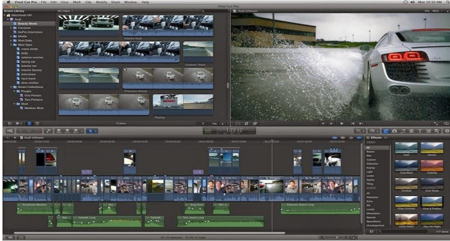
صفحة من برنامج المونتاج Avid media composer

- إضافة إلى برنامج المونتاج Avid media composer: وهو برنامج مونتاج علمي بنسخته الأخيرة الصادرة سنة 2009 الحاملة لرقم 4.04.9350 Avid media composer حيث تم تجهيز المحطة بهذا البرنامج مع أحدث شاشات الكومبيوتر (03 شاشات كومبيوتر)، والمجهزة بأعلى التقنيات من وحدات مركزية وقارئة الذاكرة أين يتم تفريغ المادة الخام للعمل الإخباري (1) .