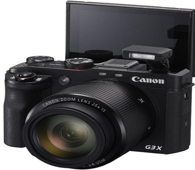
كاميرا GX3 HD

- كاميرا GX3 HD : كاميرا رقمية صغيرة الحجم مدمجة من شركة "كانون Canon" مع جهاز استشعار CMOS، صور كبيرة وعدسة سريعة تعمل على تسجيل فيديو أو التقاط الصور بدرجة عالية وذات جودة ورؤية جمالية جيدة (1) .