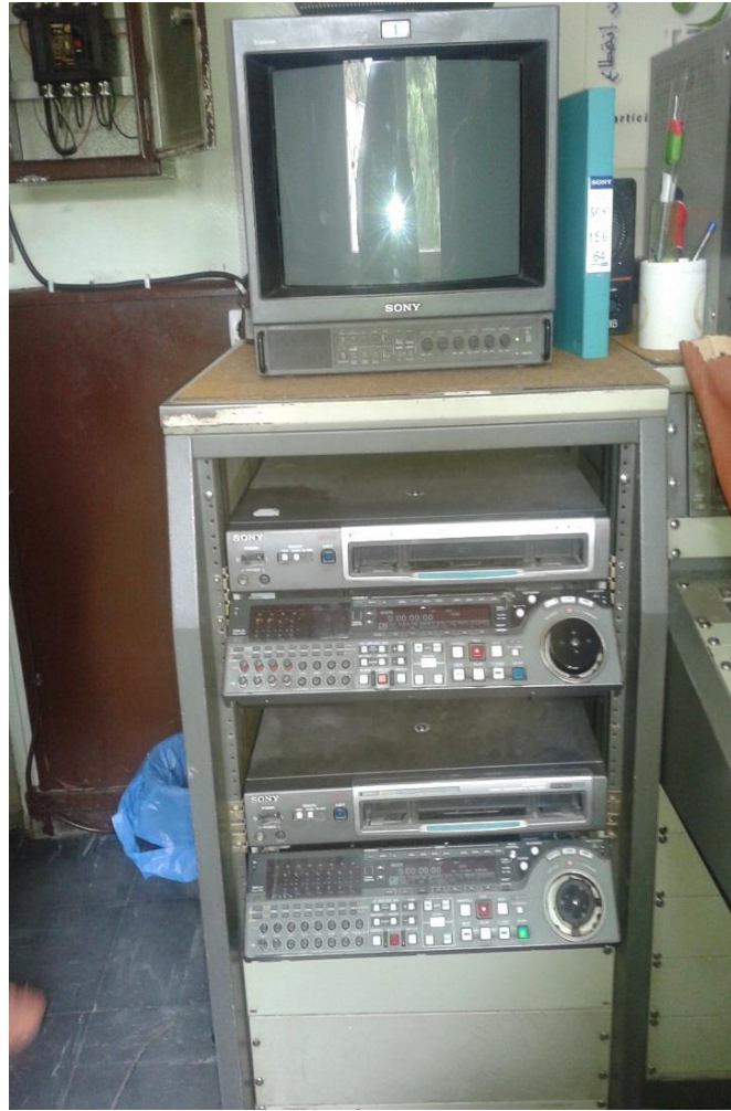
خلية مزج صورة وصوت آلة بآلة

- وتتم الاستعانة أيضا بالتقنيات المستخدمة في عملية المونتاج، وهي عملية مزج الصوت والصورة آلة بآلة (1) .