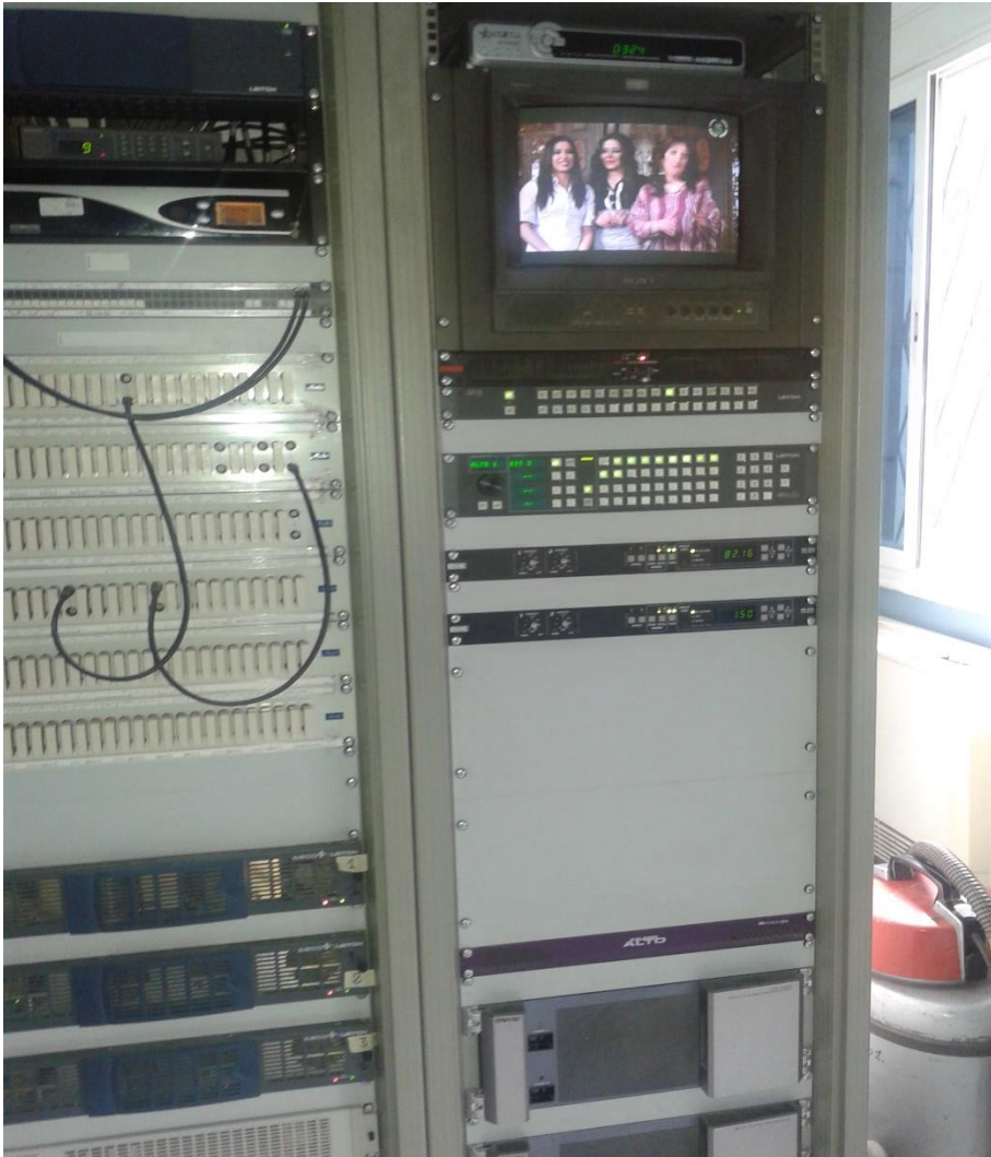
ضبط الصورة والصوت بالرفة التقنية