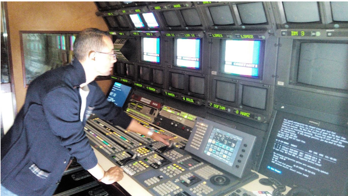
الأجهزة الرقمية بالحافلة المتنقلة