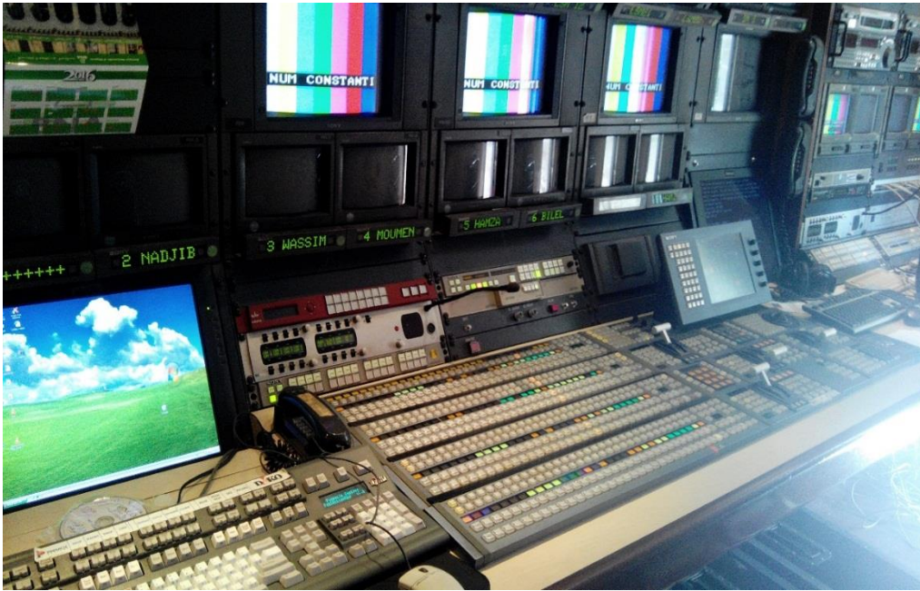
الأجهزة التقنية المجهزة بها الحافلة المتنقلة (جزء منها فقط)

- ما تم الاتفاق عليه من خلال مجموع أفراد العينة التي تم استجوابها هي أن الأجهزة التقنية والهيكلية الموجودة في المحطة هي موافقة للمعايير الدولية بدءا من العتاد التقني القديم وصولا إلى العتاد التقني الحالي المتوفر على مستوى المحطة، وبمقاييس عالمية عالية الجودة حيث تتوفر على مزايا عديدة أهمها: النقل المباشر للتغطيات الإخبارية الذي يربط المحطة الجهوية بالمحطة المركزية مثل: نشرة الظهيرة كل يوم الخميس من كل أسبوع، وما زاد الأمر سهولة هي الفرقة التقنية المتنقلة والتي تم تجهيزها بتقنيات البث والبعث في أي وقت وفي أي مكان (حافلات متنقلة مجهزة بأجهزة اتصال وتقنيات البعث والارسال) (1) .