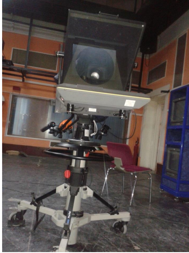
كاميرا رقمية مجهزة بتلي برومبتار (télépromptaire)

- وقد تم تخصيص استوديو واحد فقط على مستوى المحطة، هذا الاستوديو يتم تجهيزه حسب كل المناسبات ووقت الأخبار كذلك (أخبار الظهر كل يوم خميس من كل أسبوع)، حيث تم تزويد الاستوديو بالإضاءة ذات جودة عالية مستخدمين بذلك أحدث تقنيات الإضاءة (مصايح إضاءة من نوع ADB)، وكاميرات متصلة بالغرفة التقنية (كاميرا رقمية مجهزة بتلي برومبتار (télépromptaire) (1) ).