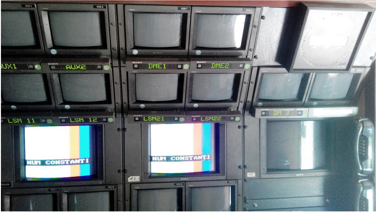
شاشات العرض بالحافلة المتنقلة