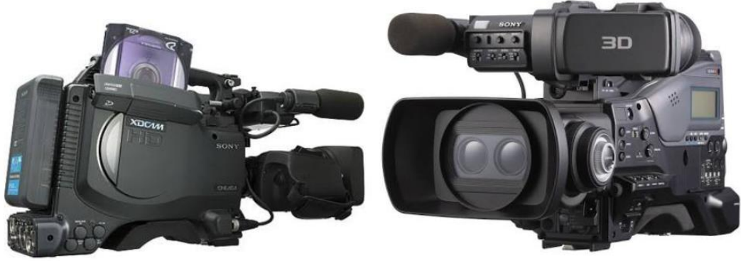
صورة كاميرا XD. CAM. HD

- كاميرا XD-CAM-HD : من إنتاج شركة "Sony"، أحدث كاميرا فيديو رقمية، تحمل على الكتف "Pw- Z450" والتي بإمكانها التقاط الصور بجودة "4K" قائمة (جودة عالية) (2160×3840) باستخدام حساس (Exmor TM CMOS) جديد من نوع 2/3، وتتميز بالوزن الرائع وتوفير الطاقة إلى جانب إمكانية الاتصال بالشبكات والأجهزة الأخرى، تعمل على بطاقة الذاكرة وعملية التفريغ تكون في قرص صلب (CD).