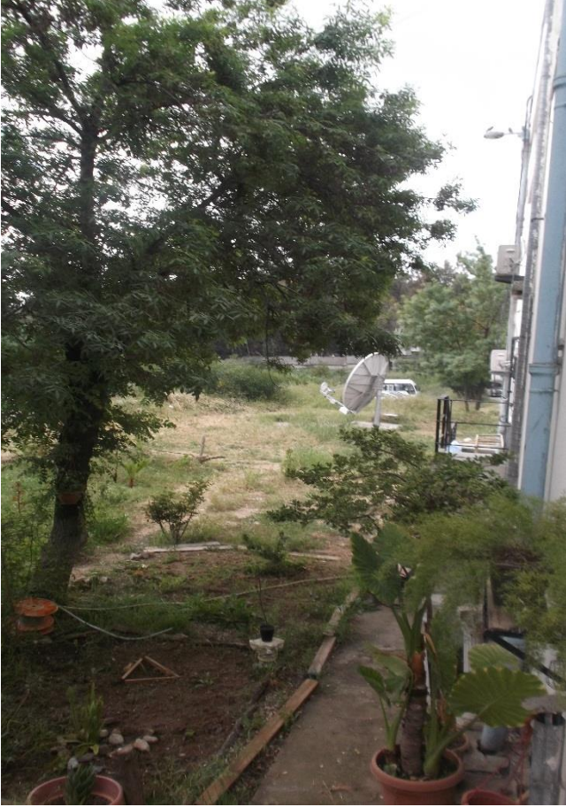
مينوس قمر صناعي للبعث

- جهاز الأونكودور: وهو جهاز مزود بمحرك ومنبع ضوئي مثقوب على الوجه متصل بسلك (فيبروتيك fibrotic) يمكن عن طريقه بث واستقبال الصورة والصوت، وبالإضافة إلى أجهزة البعث والاستقبال التي تم إيصالها بالقمر الصناعي (مينوس).